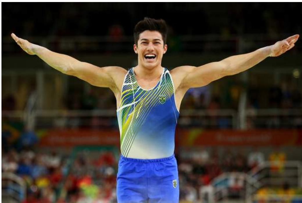
그림 1. 양팔 들고 미적표현 착지자세