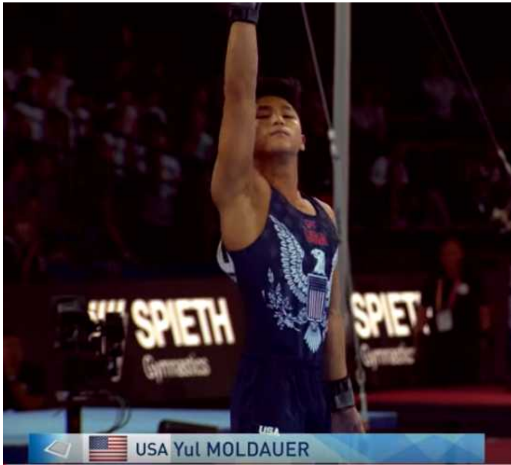
그림 3 . 연기시작 전 미적표현 자세