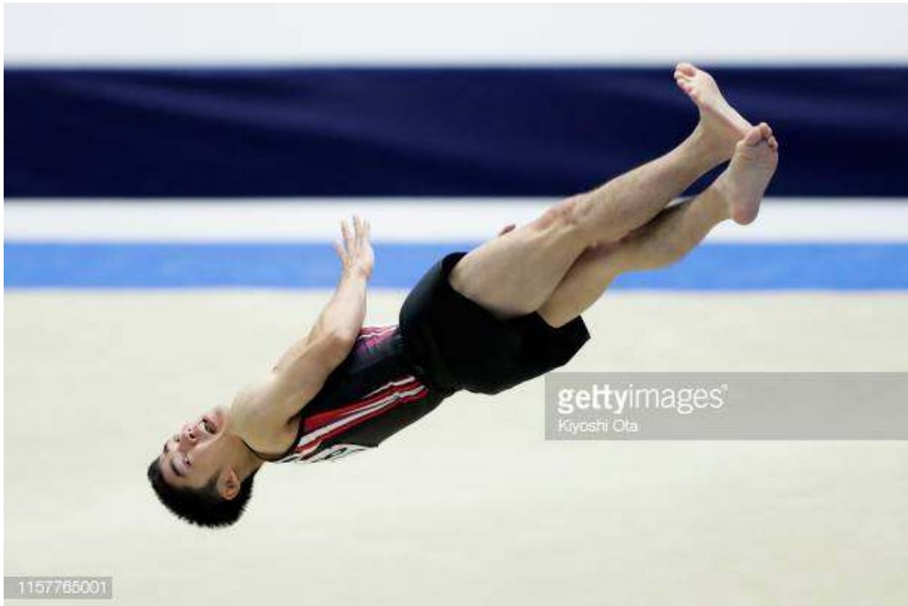
그림 5. 연기기 시 발끝 굽혀짐 0.2감점