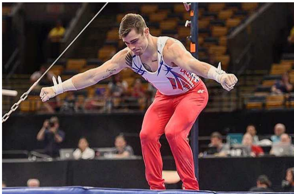
그림 2. 착지 후 미적표현 착지자세 (프로텍터를 착용하지 않는 종목일 경우 손끝까지 펴야함)