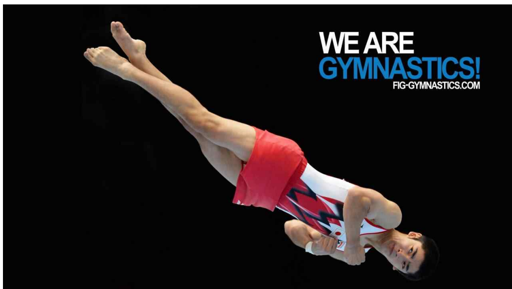
그림 4. 비틀기 시 다리 겹쳐짐 0.2감점