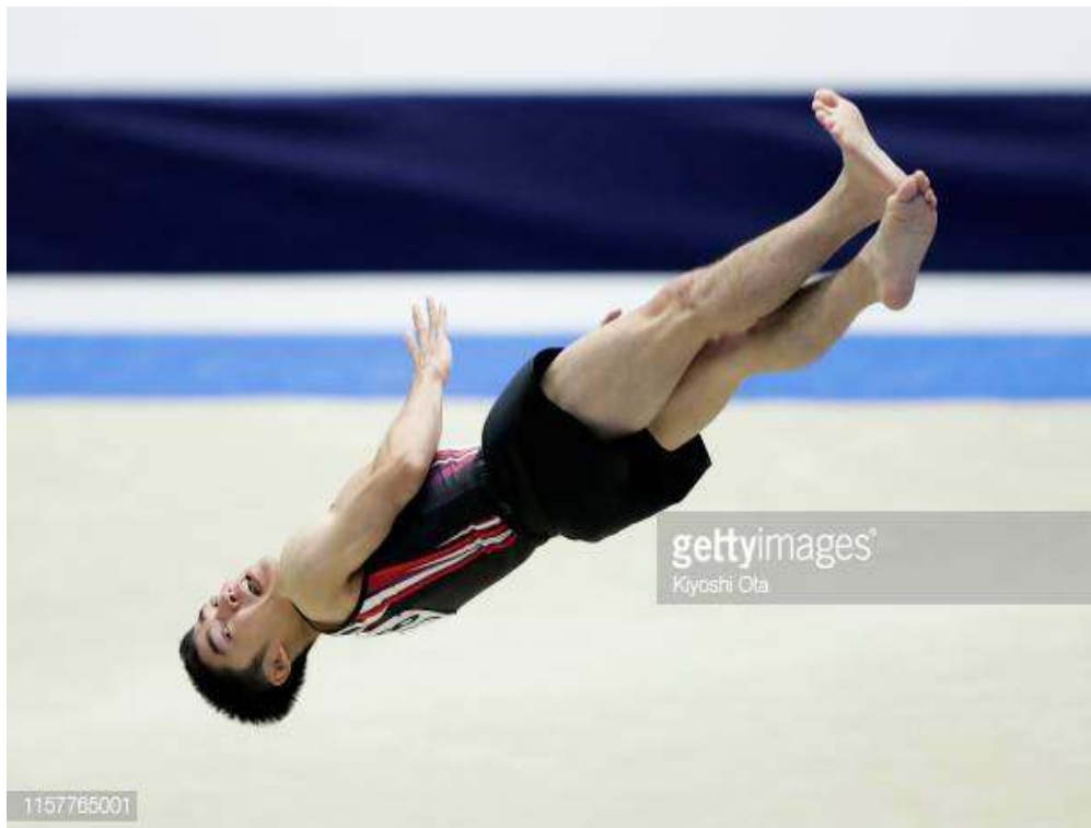
그림 5. 연기기 시 발끝 굽혀짐 0.2감점