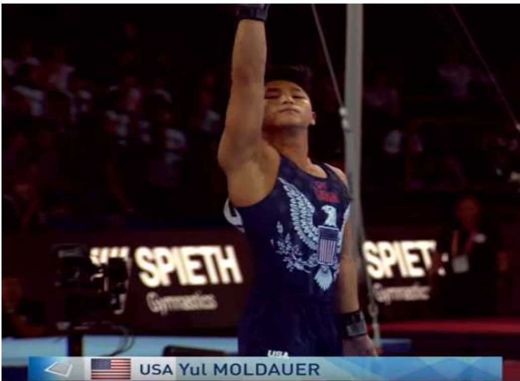
그림 3 . 연기시작 전 미적표현