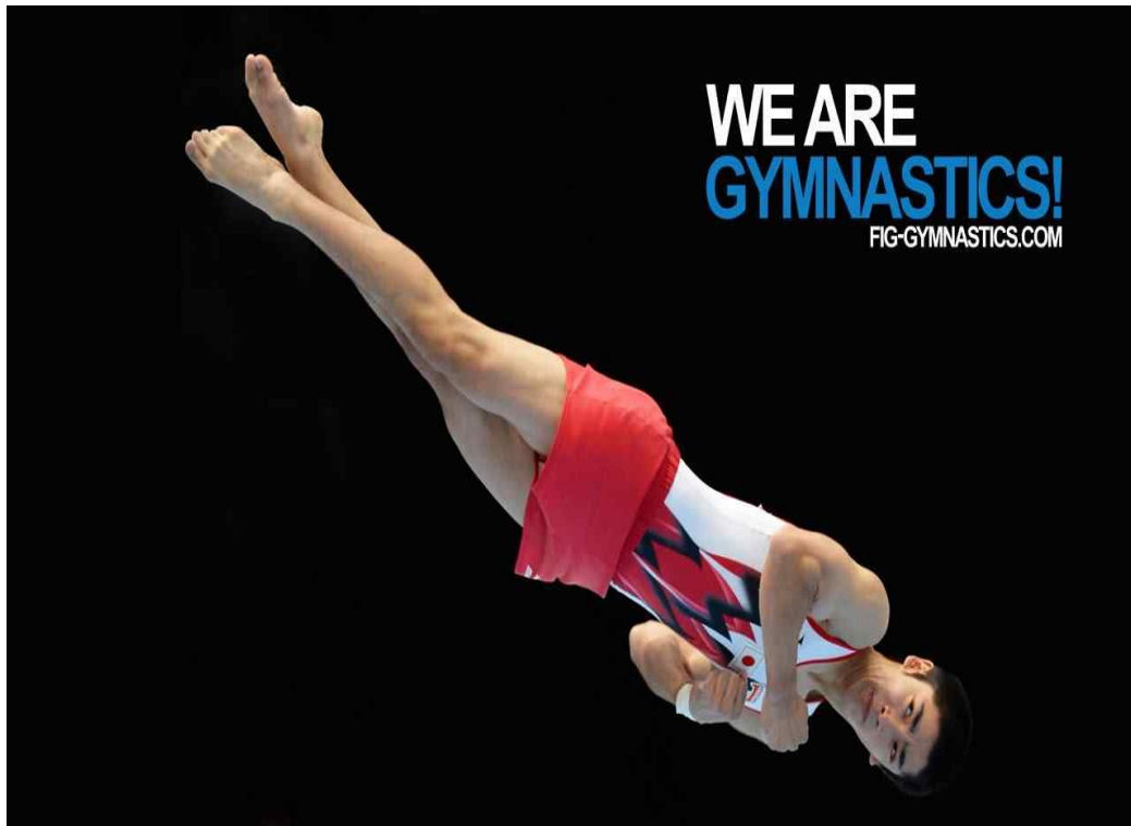
그림 4. 비틀기 시 다리 겹쳐짐 0.2감점