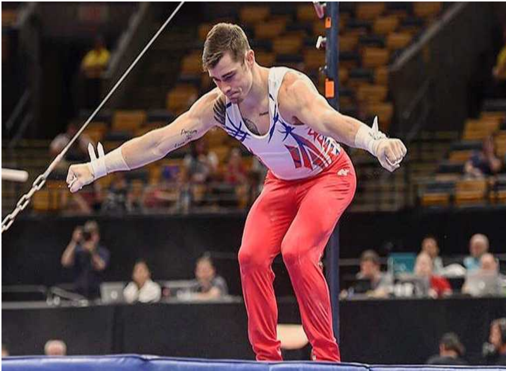
그림 2. 착지 발이 닿는 순간 미적표현 착지자세 (프로텍터를 착용하지 않는 종목일 경우 손끝까지 펴야함)